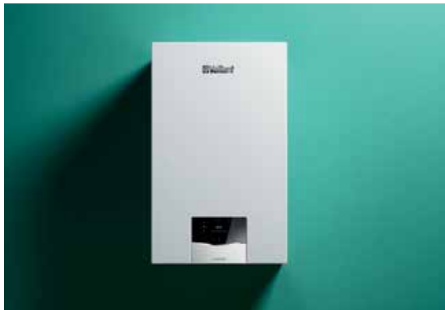
ecoTEC plus VUW

Raportul său optim performanță-preț îl face întotdeauna cea mai bună alegere. Datorită noii sale funcții inteligente „IoniDetect”, aparatul gestionează singur tipul de gaz și calitatea fluctuantă a acestuia. Un alt avantaj este reprezentat de designul compact: spre exemplu, ecoTEC plus cu puteri ridicate va fi ideal pentru înlocuirea economică din punct de vedere al spațiului al centralelor vechi.